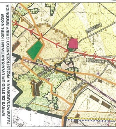
WYRYS ZE STUDIUM UWARUNKOWAŃ I KIERUNKÓW ZAGOSPODAROWANIA PRZESTRZENNEGO GMINY BRODNICA

Załącznik nr 1 do Uchwały Nr 1027/15 Rady Gminy Brodnica z dnia 10 maja 2015 r. Powierzająca planu sk. 1:800 ha.